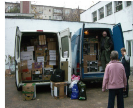
Så går vi i gang med at læsse af