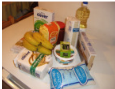
Indhold af muleposerne