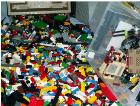
Vask og tørring af Legoklodser