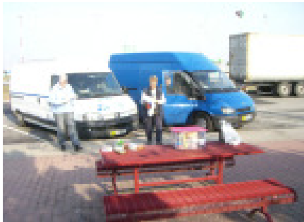
Frokost, ikke i det grønne, men på en rasteplass

Vi satte os ind i restauranten for i ro og mag at indtage et solidt morgenmåltid.