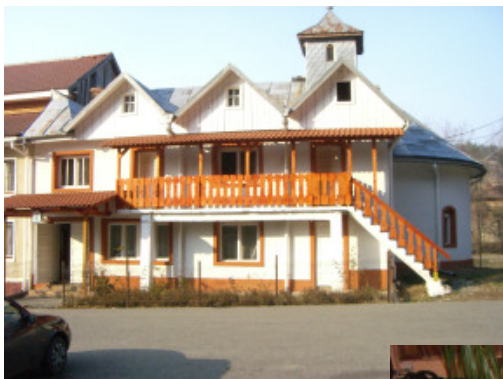
På vej tilbage fra Eftimie Murgu besøgte vi klostret Almaj-Putna