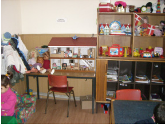
De passer godt på tingene. Her står bl.a. dukkehuset fra sidste år