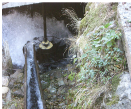
Fuld fart på møllehjulet