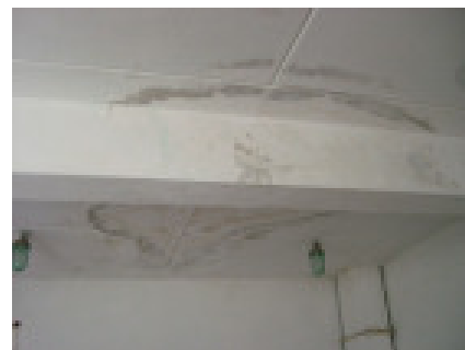
Loftet ser ikke så godt ud, vandet er trængt ned gennem det utætte tag