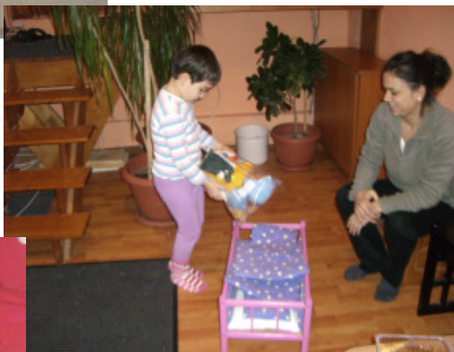
En lidt betuttet lille pige på skolen i Dubova