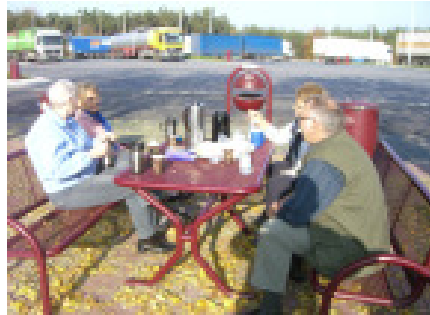
Det er dejligt med en kop kaffe efter en god frokost

Vel ankommet til Rostock satte vi kursen mod Berlin, Dresden og grænsen til Tjekkiet.