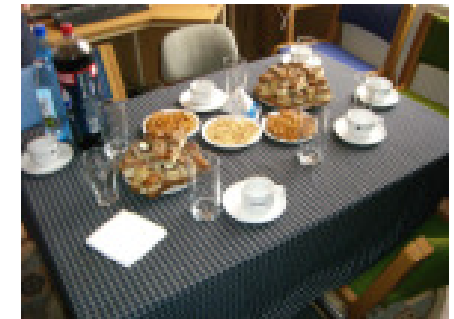
Vi bydes på cola, vand, kaffe og kager

Fredag formiddag besøgte vi skolen i Dubova. Vi ville give børnene nogle af de Lego klodser, vi har fået fra danske børn. Inden vi fik lov til at træffe børnene blev vi budt på kaffe m.m. på lærerværelset.