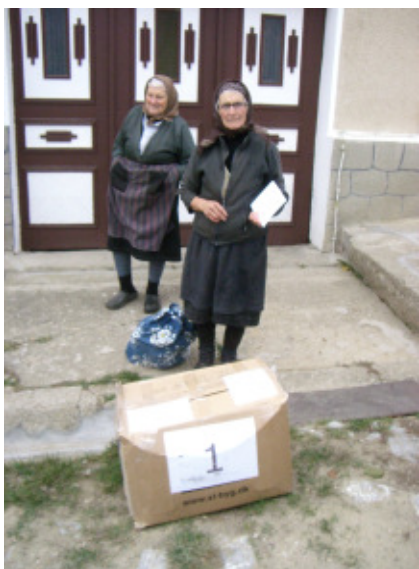
Første pakke afleveres

Vi var ventet overalt. Børnene fra skolen havde sladret derhjemme, så alle var klar over, at vi var undervejs med de spændende pakker.