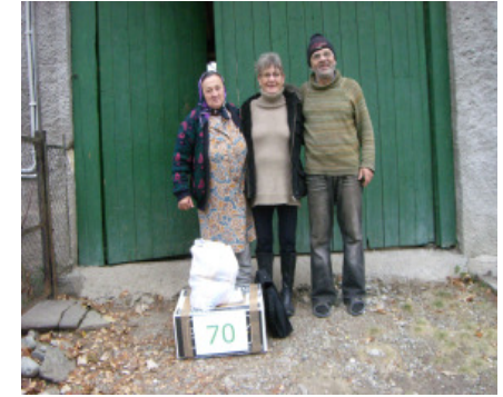
Bitten med sin familie, datteren er nu begyndt i skole i Orsova

at denne mor var taget til Tjekkiet. Lad os håbe, at det betyder en bedre og mindre slidsom tilværelse for familien.