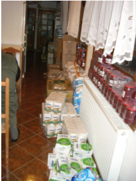
Klar til start, pakning af muleposer