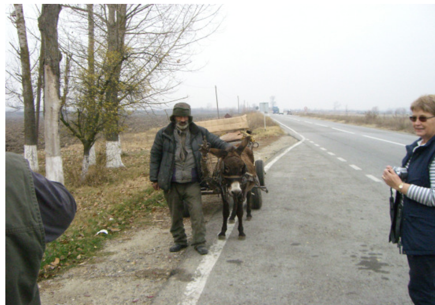
Vi fik en hyggelig snak med denne rumænske mand og hans æsel. Han bad om at få tilsendt et billede, og med den flotteste skrift gav han os sin adresse. Han får selvfølgelig et brev med vedlagt foto.