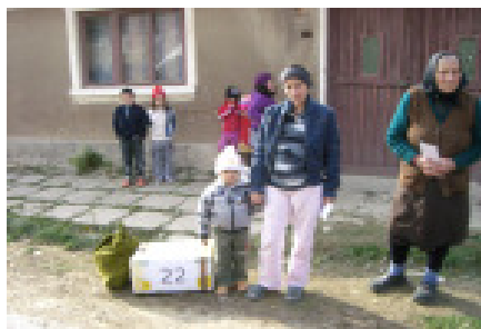
Trængsel hos fotografen

Vi var ventet overalt. Børnene fra skolen havde sladret derhjemme, så alle var klar over, at vi var undervejs med de spændende pakker.