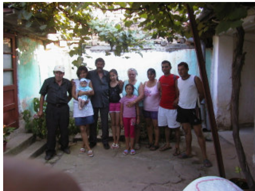
Her står vi så alle på rad og række